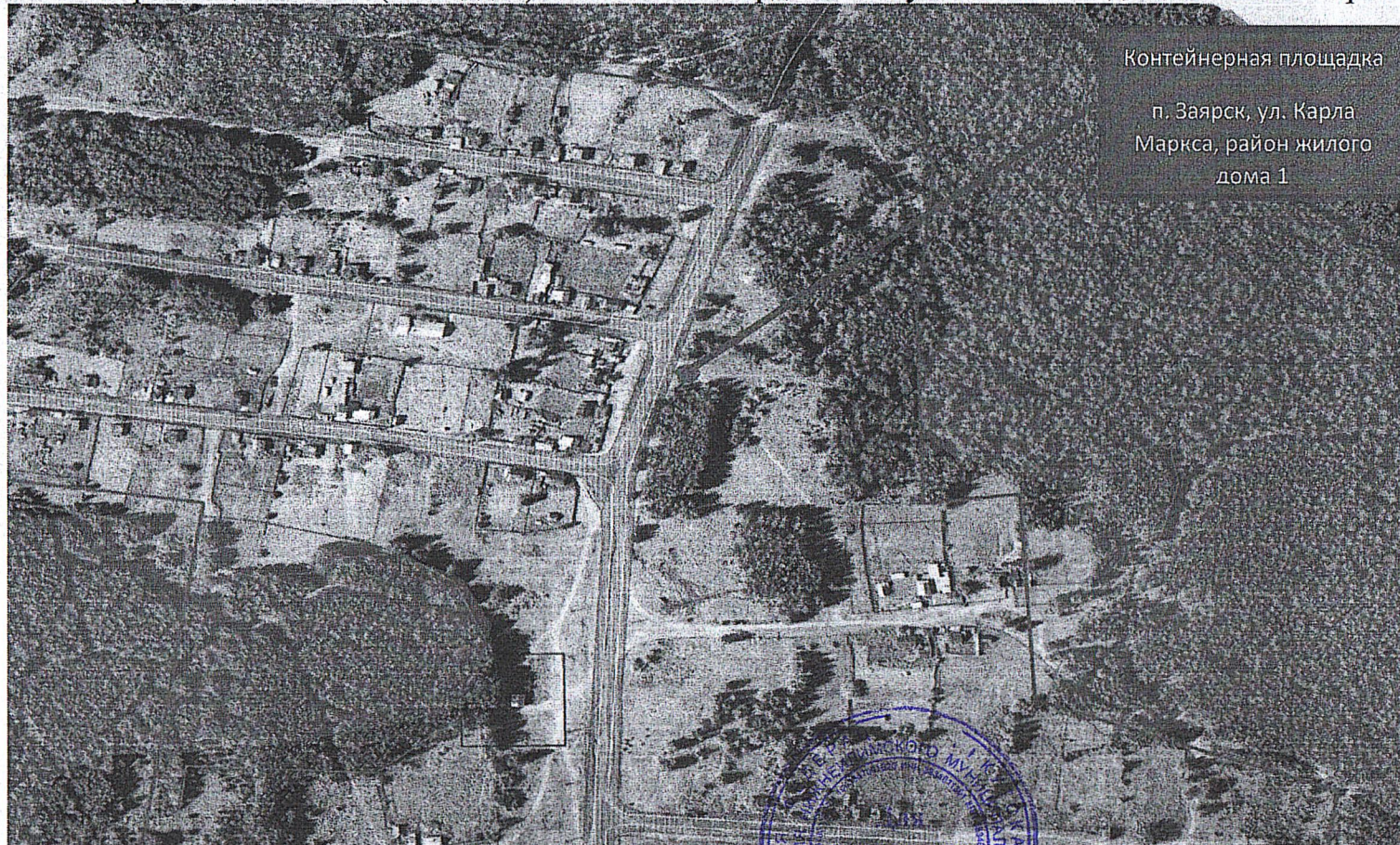
Схема размещения мест (площадок) накопления твердых коммунальных отходов в поселке Заярск Нижнеилимского района

Приложение № 2 к постановлению администрации Нижнеилимского муниципального района от 22.04.2022 № 358